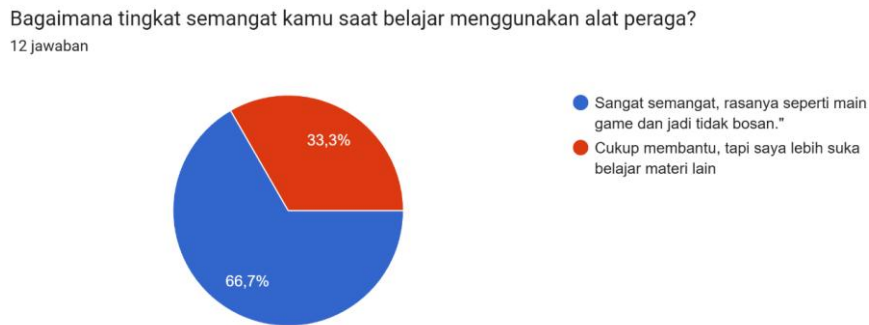
Gambar 3. Diagram tingkat semangat saat belajar menggunakan alat peraga

Data dari observasi mendalam menunjukkan keterlibatan dan antusiasme siswa dalam kelas juga meningkat. Model pembelajaran berubah dari transfer pengetahuan pasif menjadi pembelajaran berbasis eksplorasi langsung. Ini menguatkan kesimpulan bahwa alat peraga memfasilitasi peran siswa sebagai konstruktor pengetahuan aktif, sesuai dengan teori konstruktivisme.